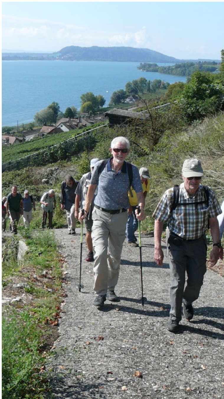
Kardan Micky Falco Neptun Pegel Cirrus Vento