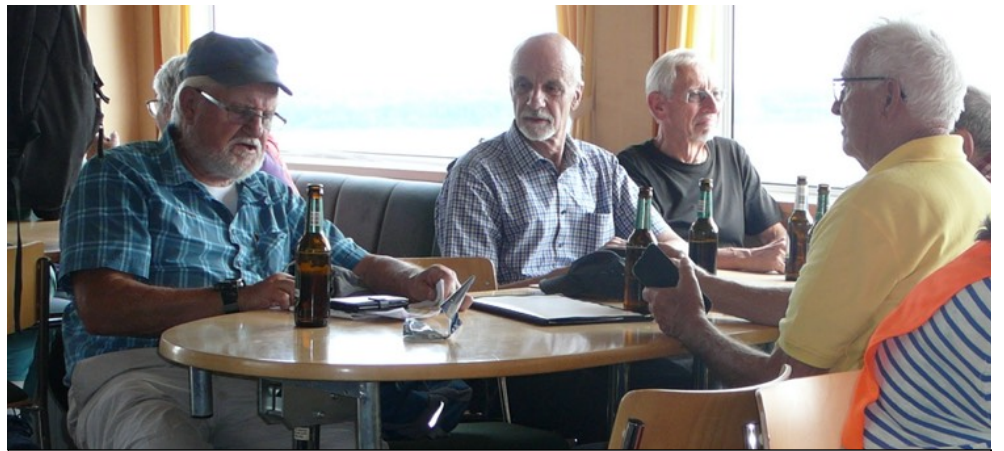
Pflueg Chlapf Goliath