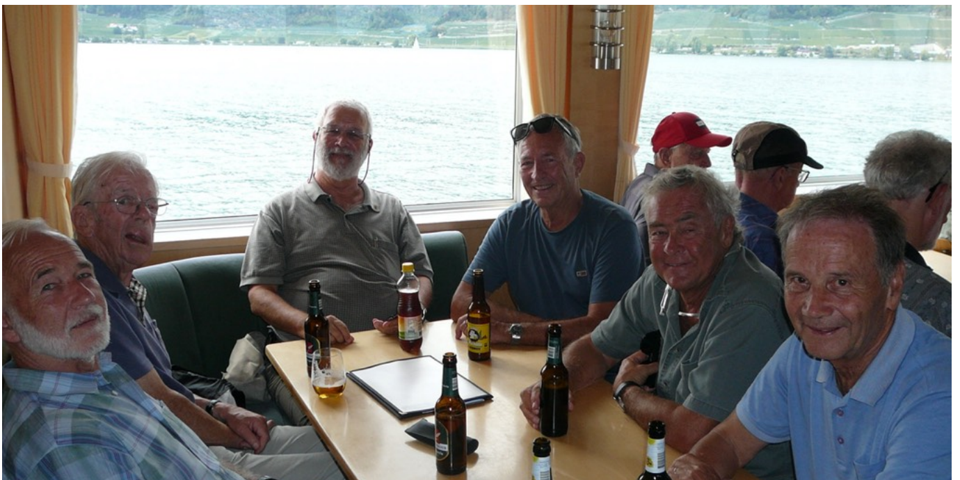
Stretch Gin Zingg Calm Flash Ready