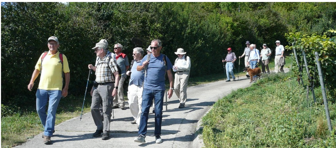
Cirrus Vento Flash Micky Calm Chrusel Patsch Pegel Huf mit Boja Ready Falco Chlotz