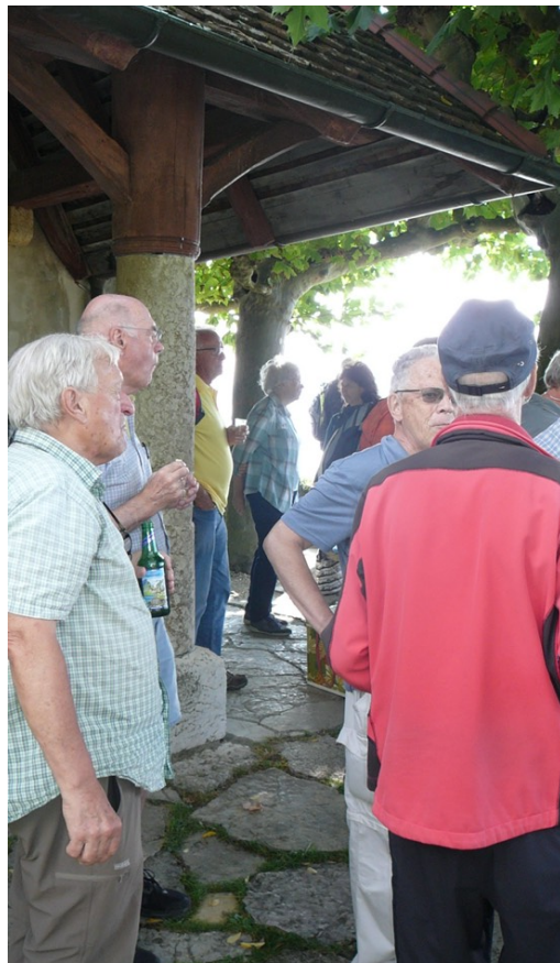
Falco Gun Franz Anita Beatrice Micky