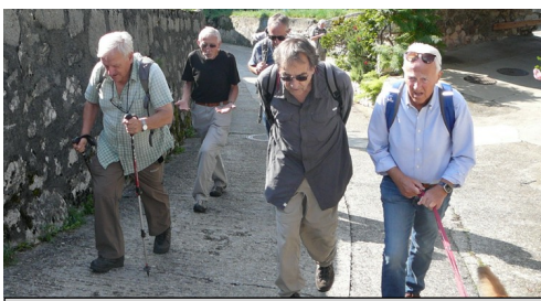
Falco Goliath Calm Neptun Huf