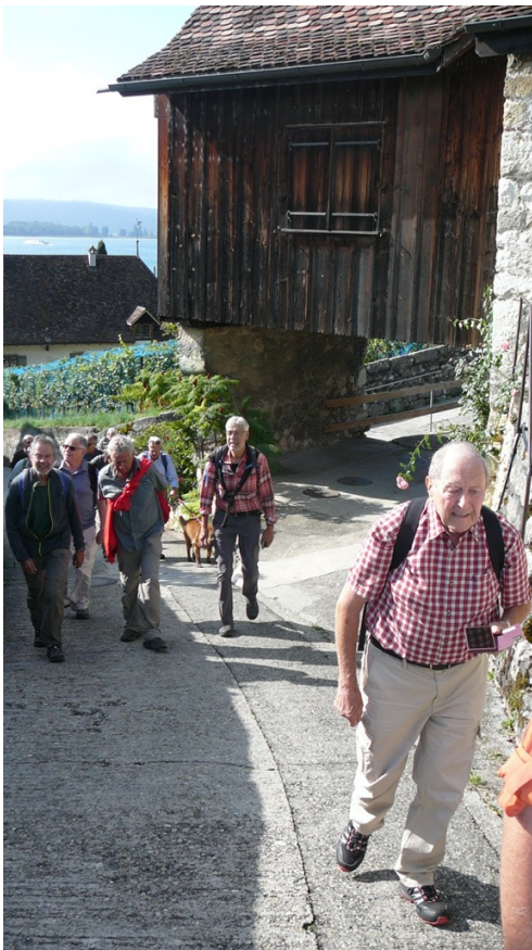
Kardan Micky Flash Huf Prim Delta