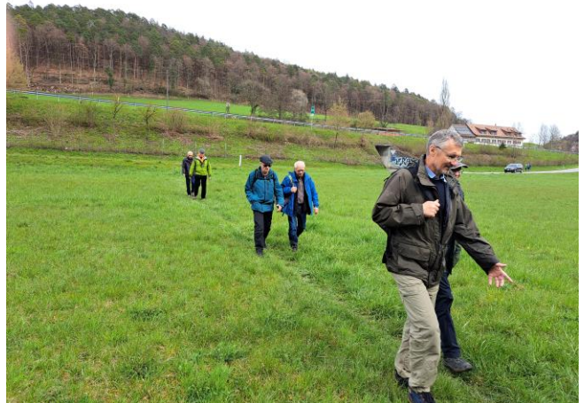
Nach dem Essen wandert eine Gruppe Unentwegter noch bis ins Birch.