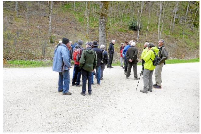
Die Weiterwanderung Richtung Ziegelhütte führt ein Stück weit durch den Herblinger Skulpturenweg.