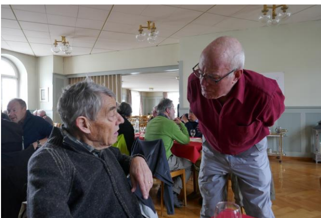
GladM und PrestoKTV, zwei „alte Neuhauser“