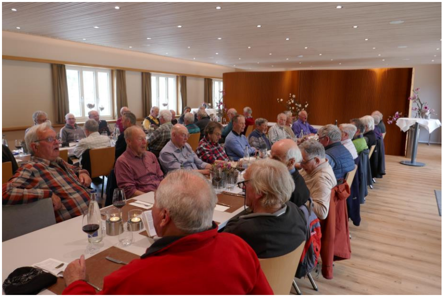
Ça, ça geschmauset...