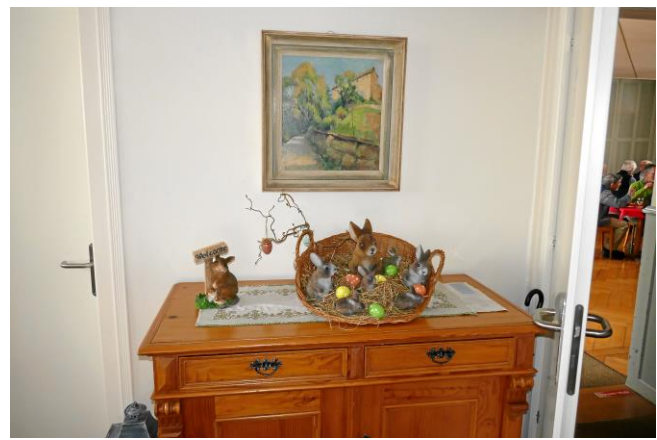
War da kürzlich was mit Hasen und Eiern?