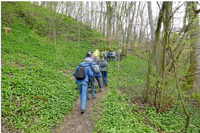
Es geht bergauf ins Churzloch.