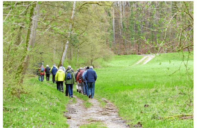
Das Churzloch liegt bereits hinter uns