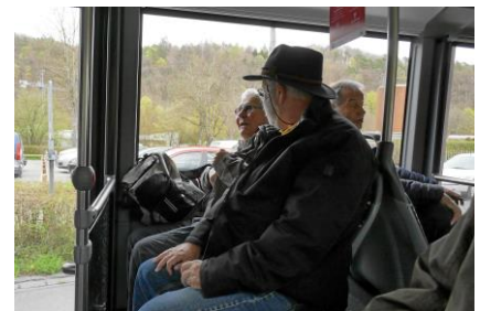
Im Bus zum Bahnhof