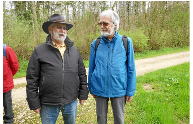
Neue Info von Zingg