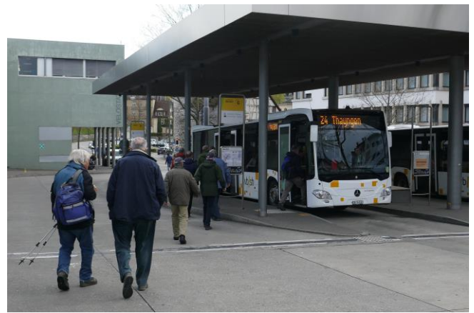
Alle einsteigen bitte!