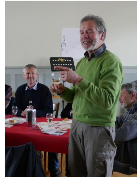
Kantusmagister Kardan in Aktion