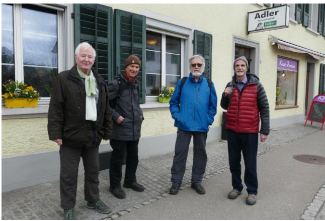
TardoKTV, Kahn, Kess, Chlapf