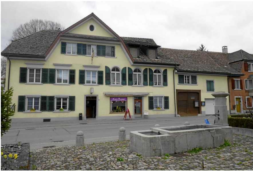
Restaurant Adler, Herblingen, Apéro