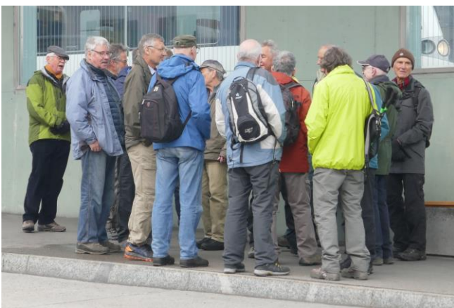
Gedränge an der Busstation Schaffhausen

Gemeinsame Wanderung AHAA KTV mit AHAA Munot. Organisiert und geleitet von Zingg/KTV.