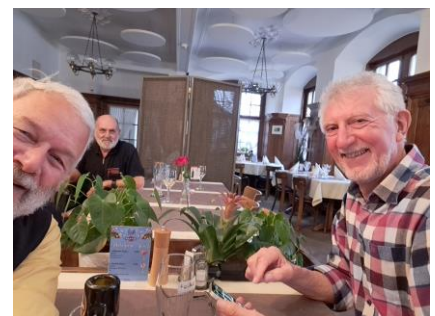
Schlussbild im Restaurant Schützenhaus