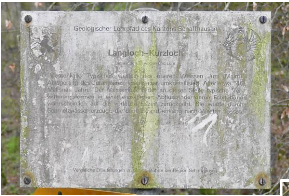
Info-Tafel Langloch – Kurzloch, April 2023

Der Fotograf verfolgt seit Jahren den Verschmutzungsgrad der Tafel.