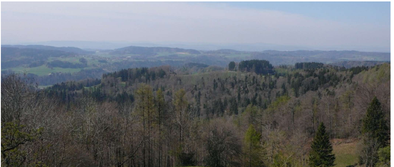
Blick vom Schauenberg Richtung Süden