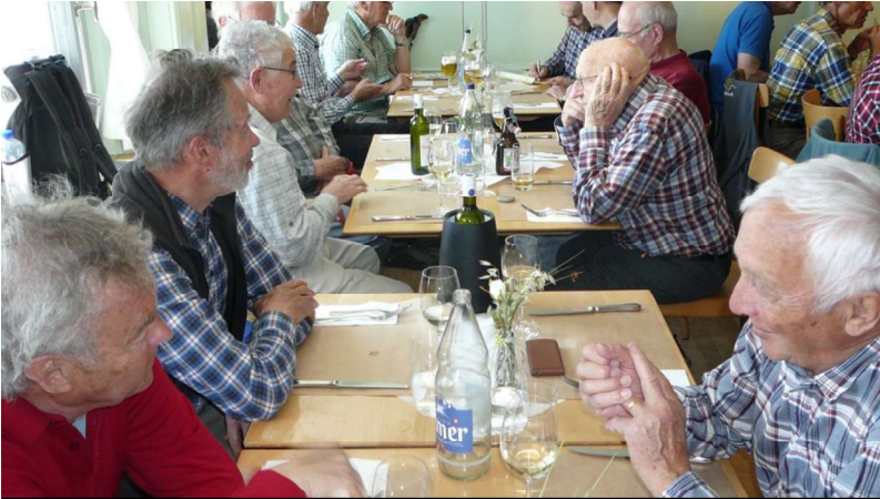
Flash Kardan Chrusel