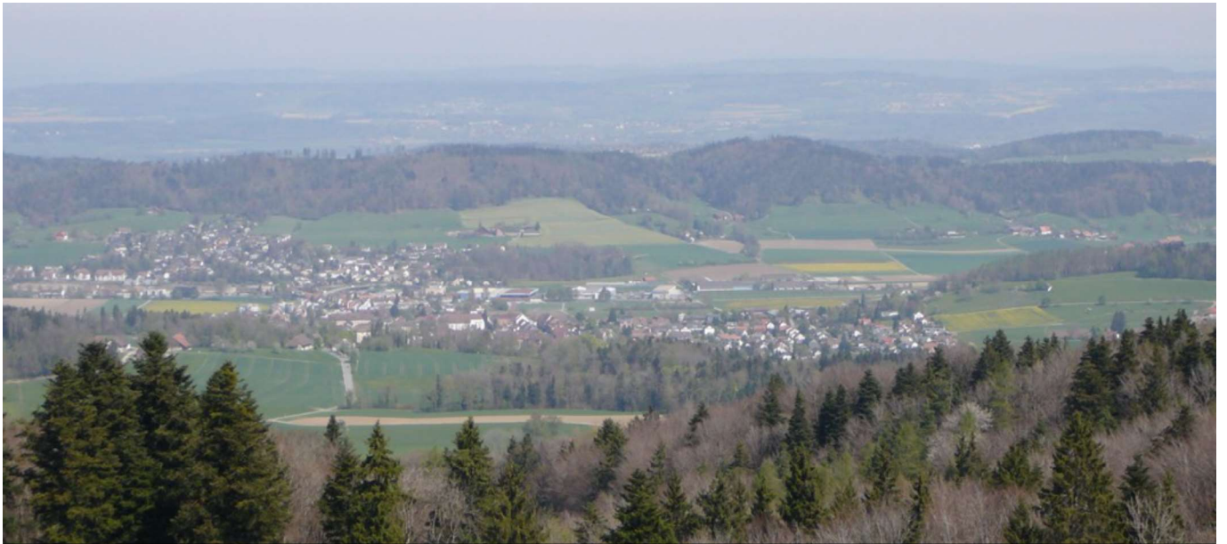
Blick vom Schauenberg Richtung Norden, im ersten Drittel von links Elgg