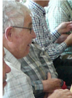
Chrusel 300. W