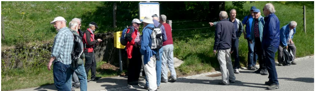
Warten auf den Bus in Oberschlatt