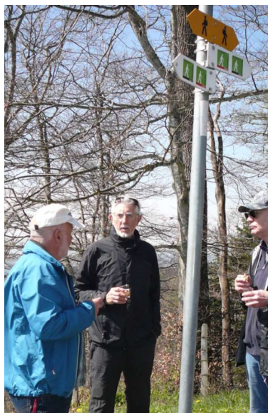
Rugel Pegel Gun