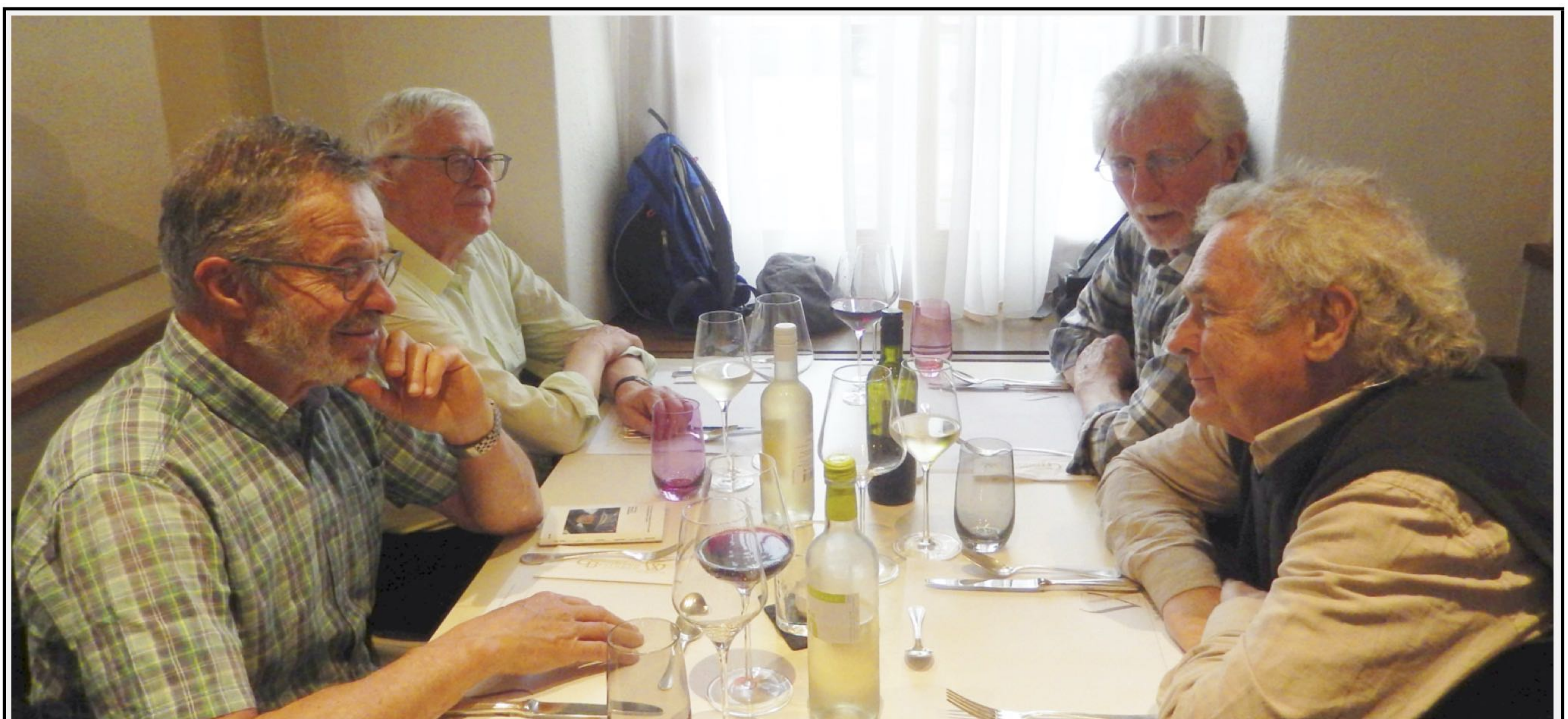
Kardan, Kanu, Pegel und Flash