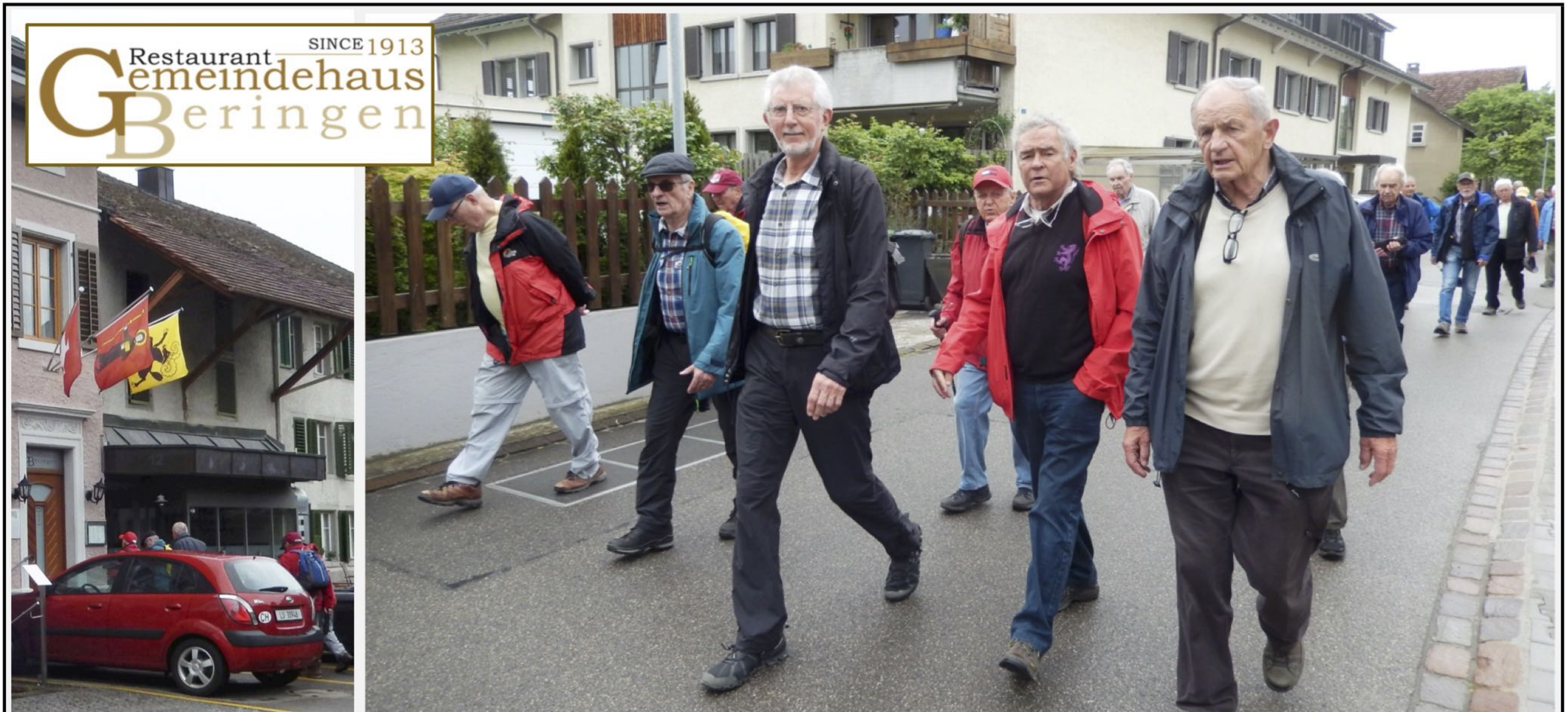
Vorneweg Presto, Vento, Delta, Pegel, Patsch, Flash, Coup, Dandy, Chap und die weiter hinten ....