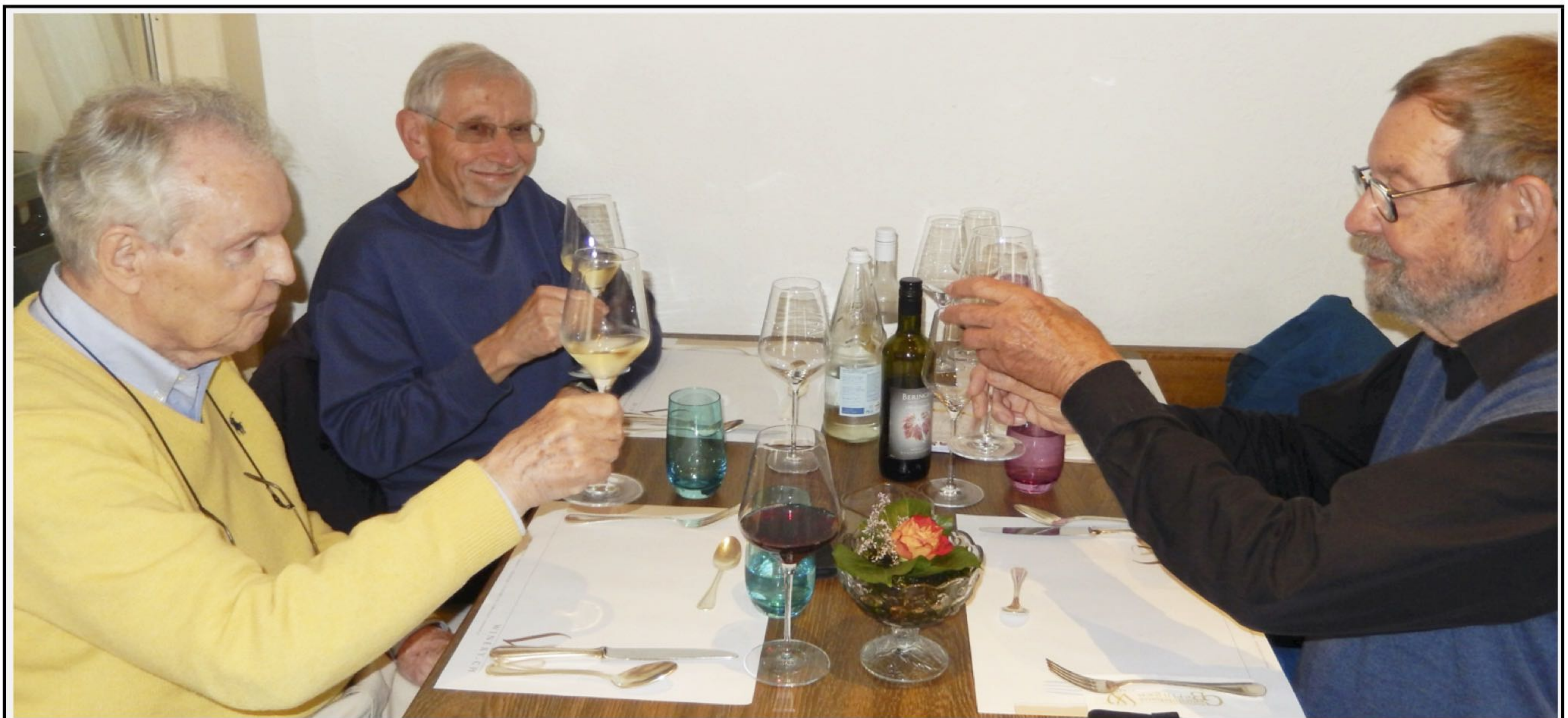
Coup, Goliath und Pröschtli