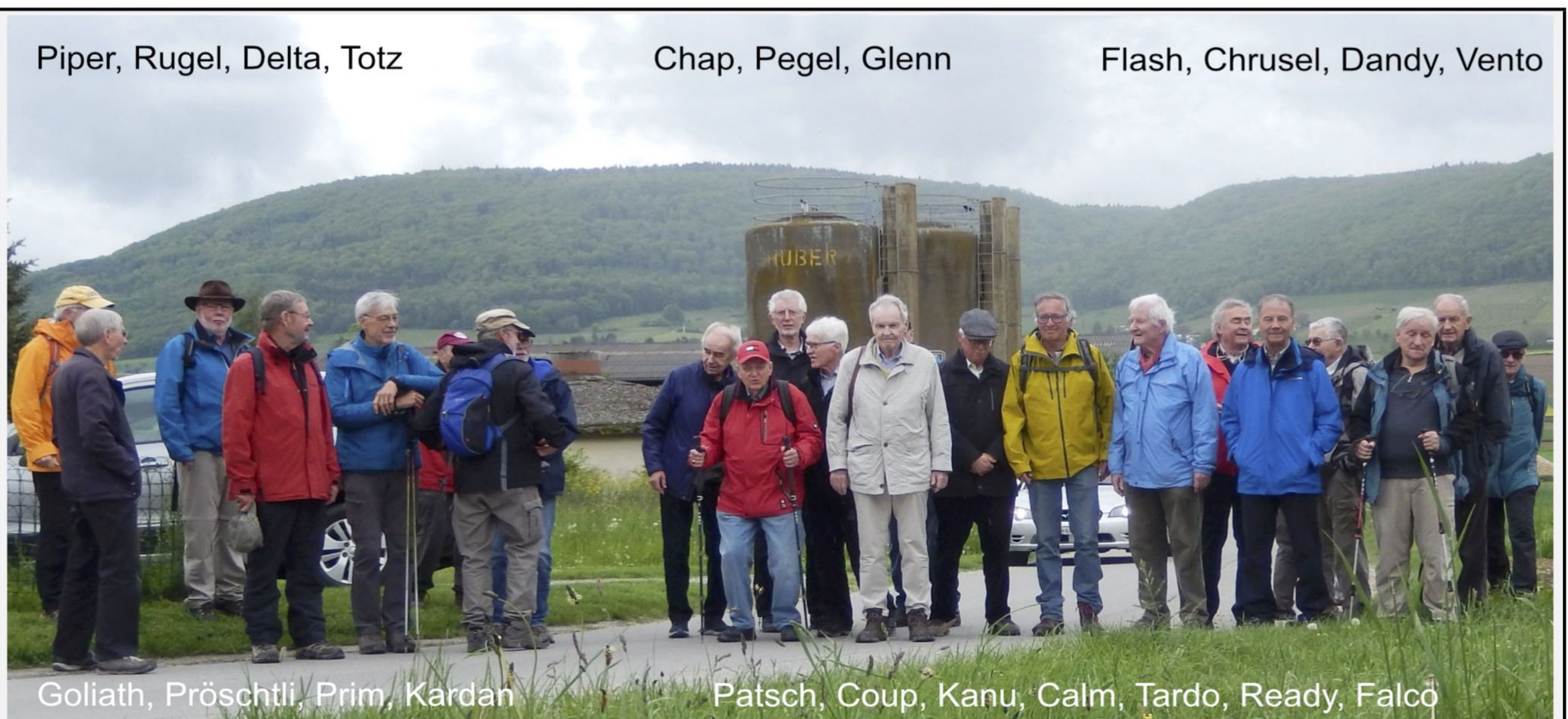
Piper, Rugel, Delta, Totz