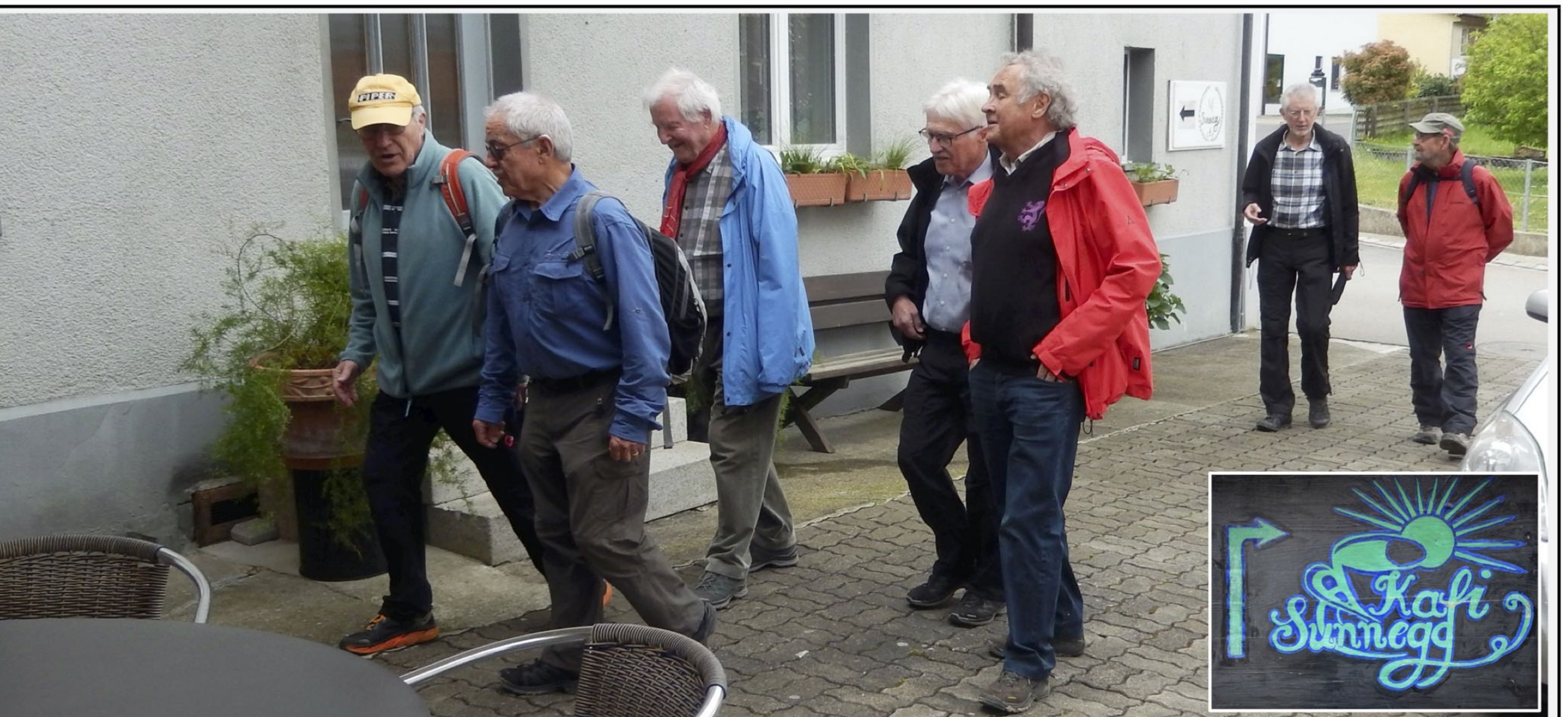
Piper, strotz - Tardo, Glenn, Flash - Pegel und Pröschtli marschieren ein