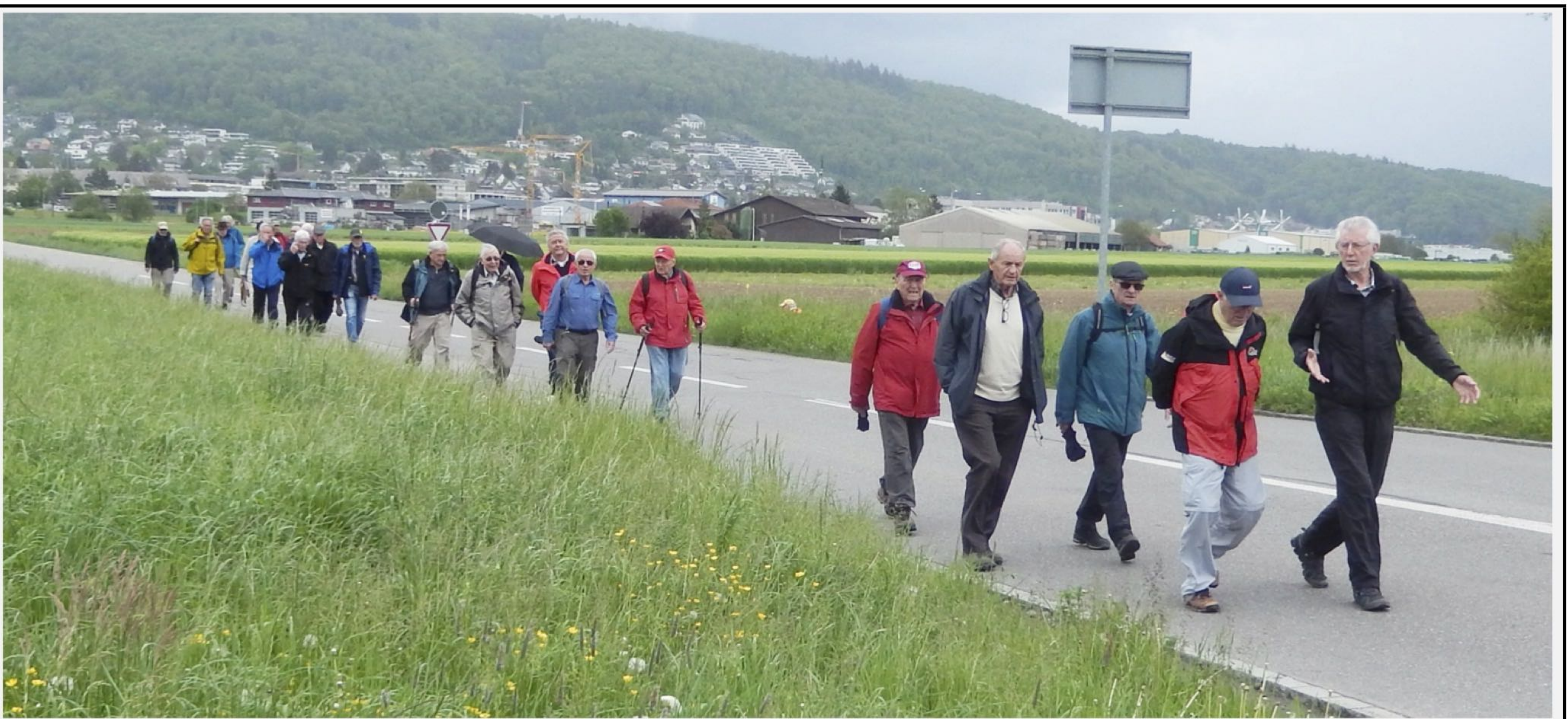
Entgegengesetzt und trotzdem Richtung Beringen