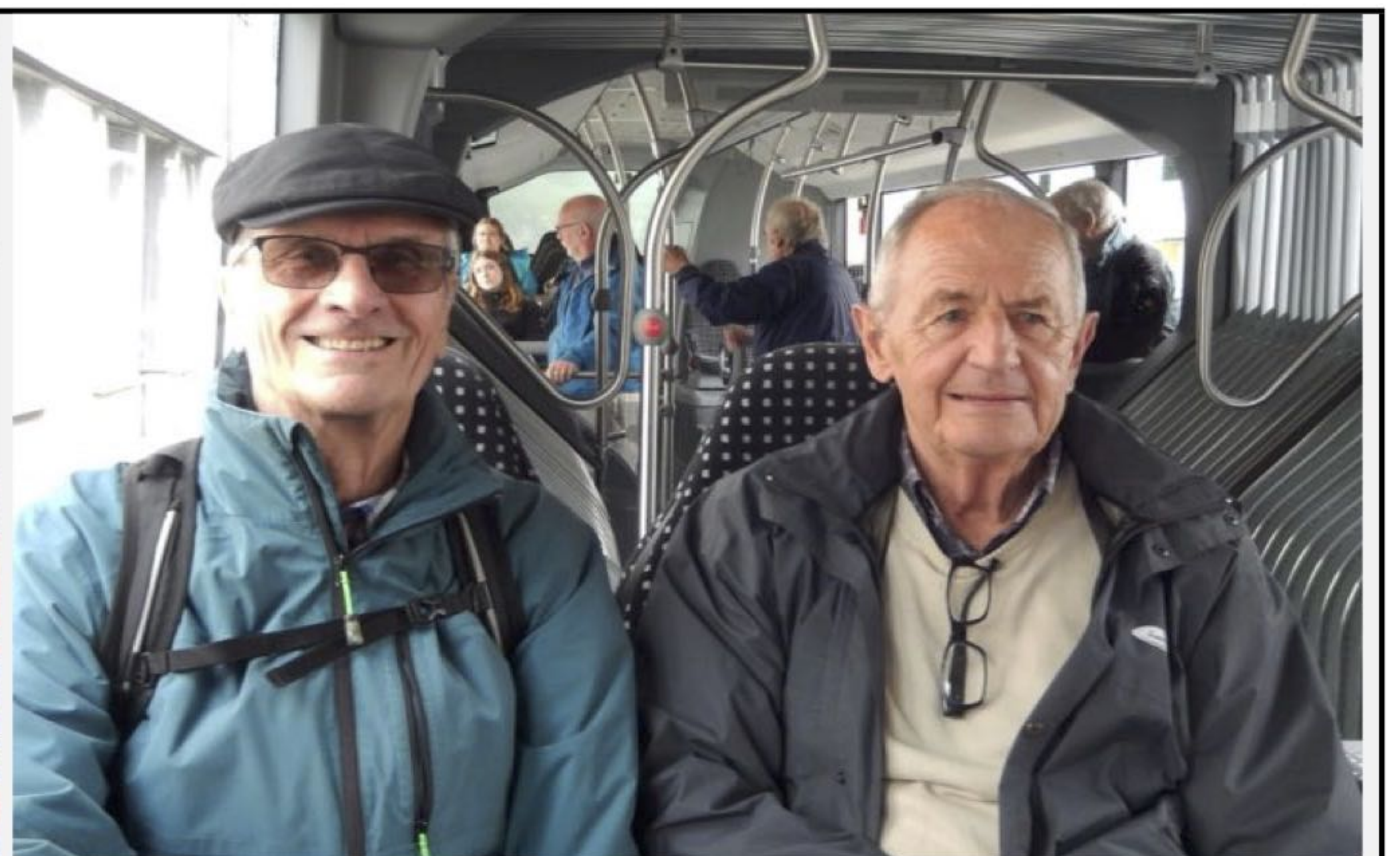
Wanderleiter Vento und Dandy