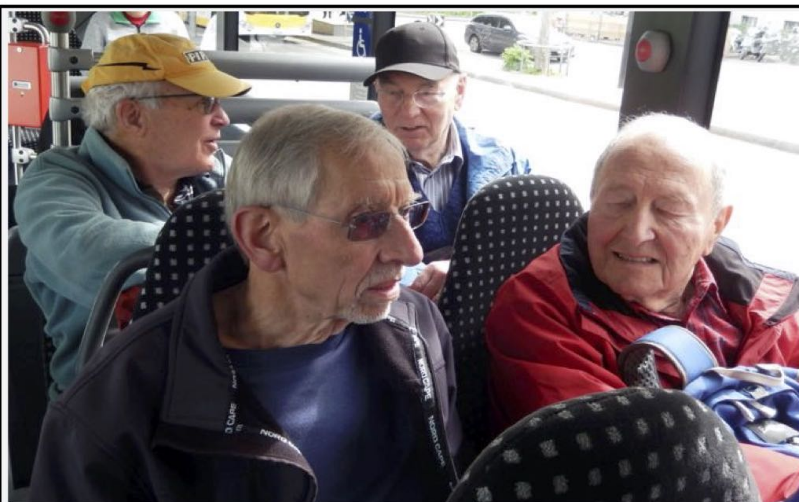
Piper, Goliath, Gun und Delta