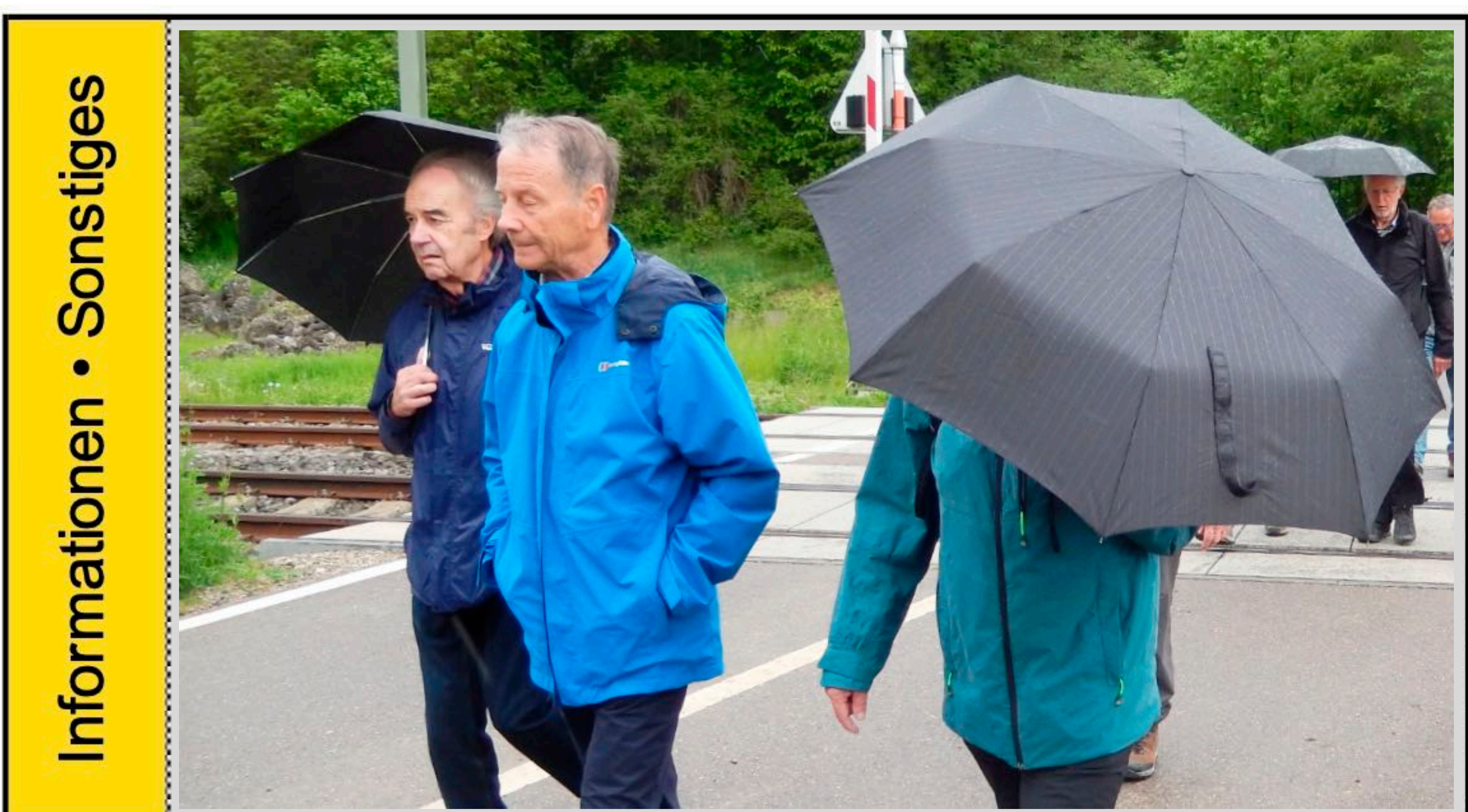
Layout von Vento

Besonderes Wegen Dichtestress am Bahnhof (diverse Bahnersatz-Busse) etwas Hektik bei der Abfahrt in Schaffhausen. Pegel nur dank Spurt und tolerantem Buschauffeur rechtzeitig im Bus. Guntmadingen: seit 2013 fusioniert mit Beringen auffällig hoher Pferdebestand im Dorf (wahrscheinlich mehr 4- als 2-Beiner) Erholsame und den Teilnehmern angepasste (Höhendifferenz!) Wanderung im Naturpark Schaffhausen: Rebberge/Landwirtschaft/ Flugplatz Schmerlat (von Ferne....) Ab und zu Probleme zwischen KTV-Wandern und Autoverkehr auf intensiv befahrener Klettgauerstrasse