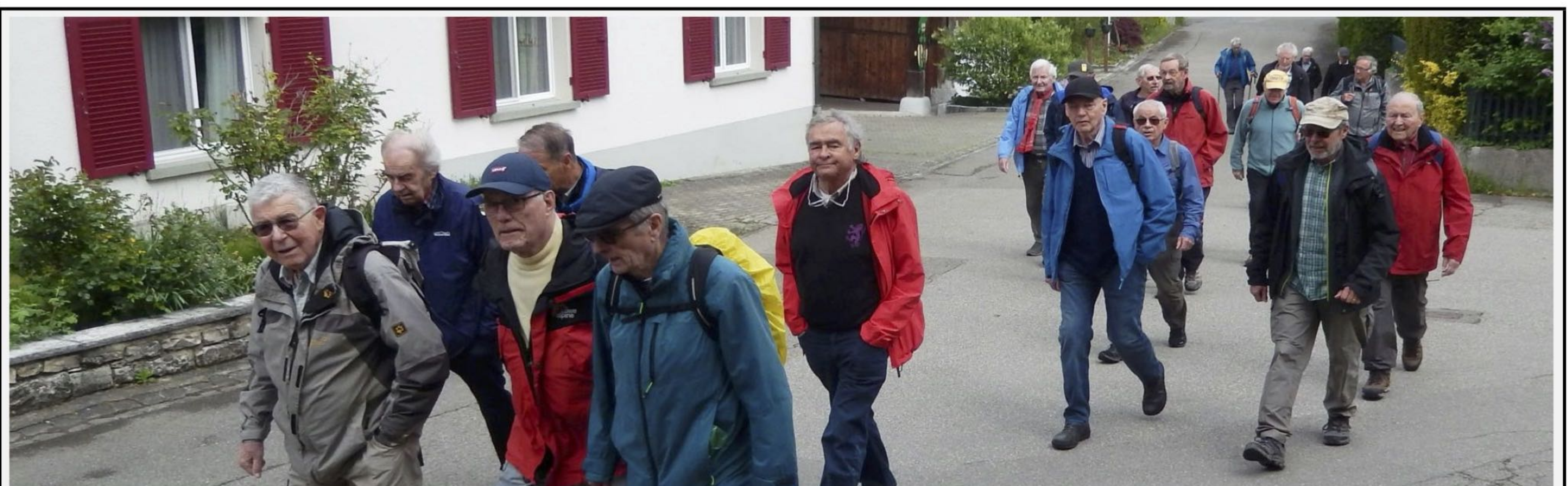
Chrusel, Chap, Presto, Ready, Vento, Flash