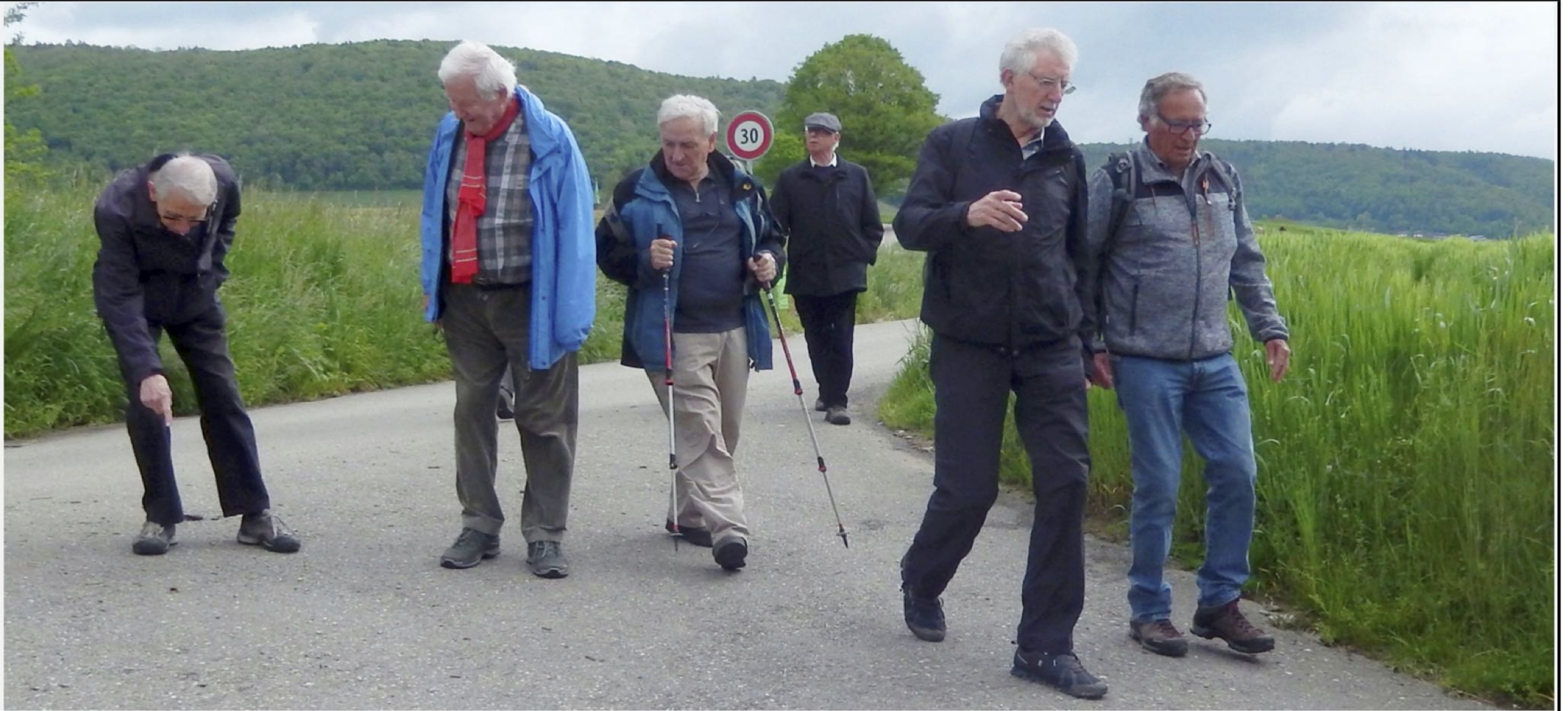
Goliath und Tardo, Falco, Kanu, Pegel und Calm