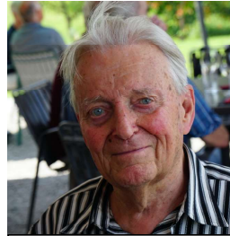
Patsch Dank für alles zuliebe Getane