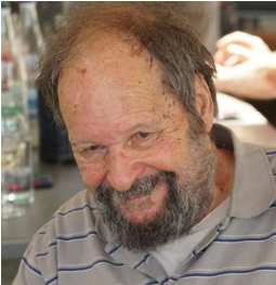
Balg 80 Drittes Viertel von acht Blauen