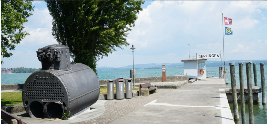
Dampfkessel des 1869 vor Berlingen gesunkenen Raddampfers «Rheinfall»