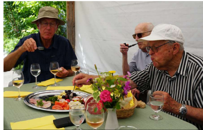
Speiche Mex Patsch