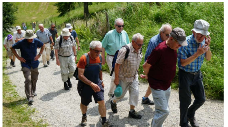
Speiche Chlotz Chrusel Strotz Coup Rido Chap Presto Gin