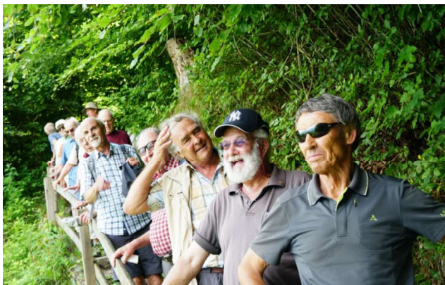
Chlapf Delta Flash Zingg Radi