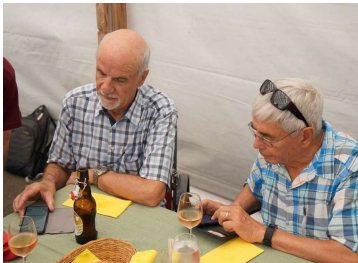
VWL Chlapf Tuba