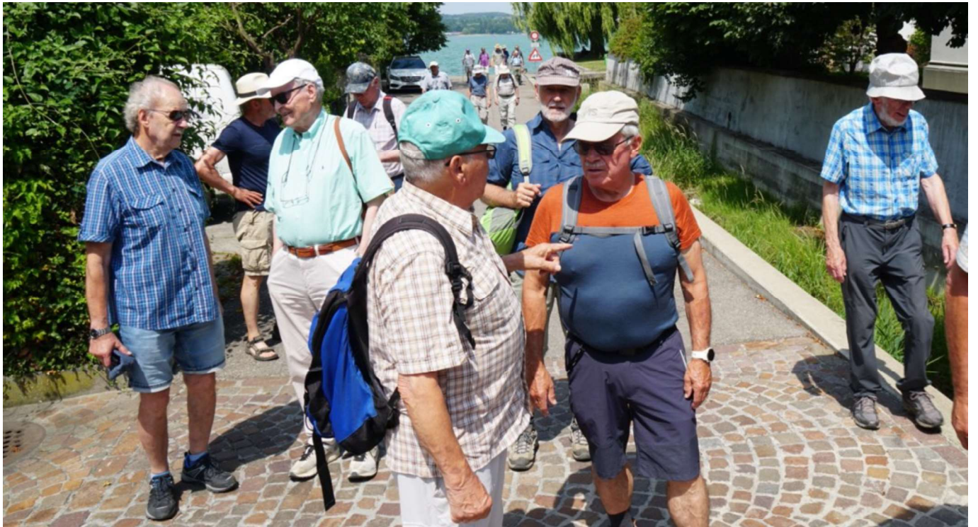
Chap Kardan Coup Gun Rido Stretch Strotz Gin