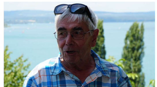
Tuba beim Vortrag der Legende über die Entstehung des Bodensees