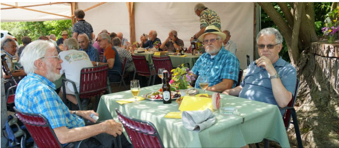
Flash Gin Chap Strotz Tuba Stretch Zingg Wurf WL Pflueg WL Micky