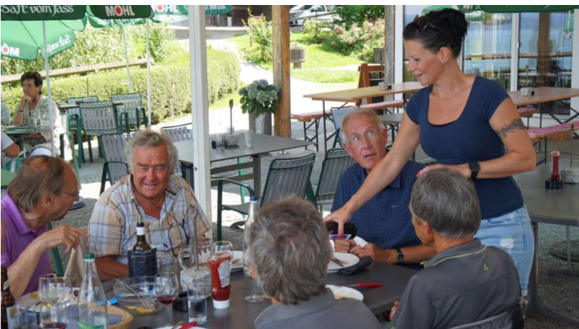
Fels Flash Calm Speiche Radi Daniela